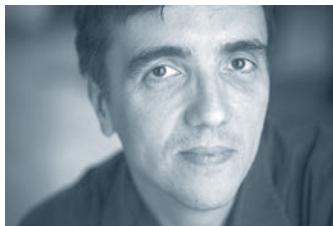
Éric LE SAGE

Né en 1964, Éric LE SAGE termine ses études au Conservatoire National Supérieur de Musique de Paris à 17 ans.