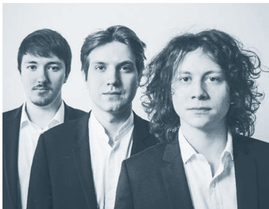
Trio Messiaen

C'est par la rencontre de trois jeunes solistes que le TRIO MESSIAEN voit le jour en 2014.