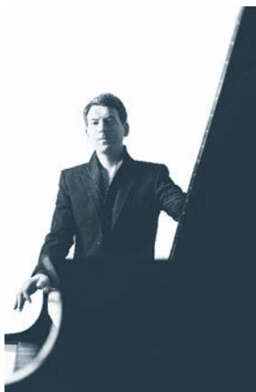
Nathanaël GOUIN

Il est fréquemment invité des émissions télévisées et radiophoniques sur France 3, Culture Box, France Musiques et Radio Classique mais aussi des Victoires de la musique Classique.