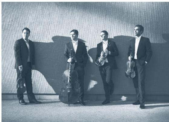
Quatuor Modigliani

"LE QUATUOR MODIGLIANI fait partie à l'évidence de la cour des grands " (Le Monde).