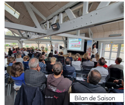
Bilan de Saison