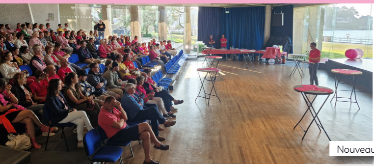
Nouveau : Roz Party