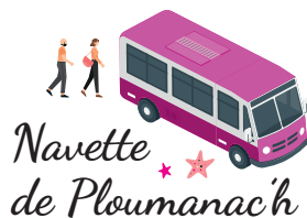
Navette de Ploumanac'h