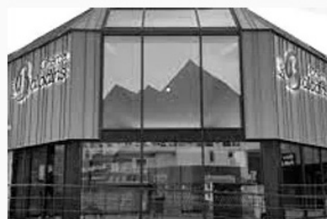
Cinéma Les Baladins