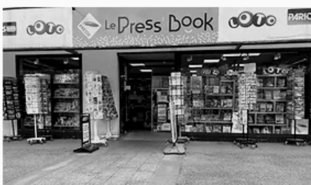
Librairie Press Book