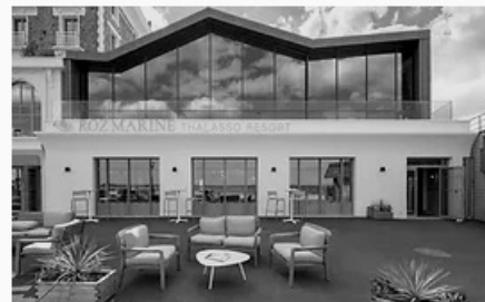
Thalasso Roz Marine