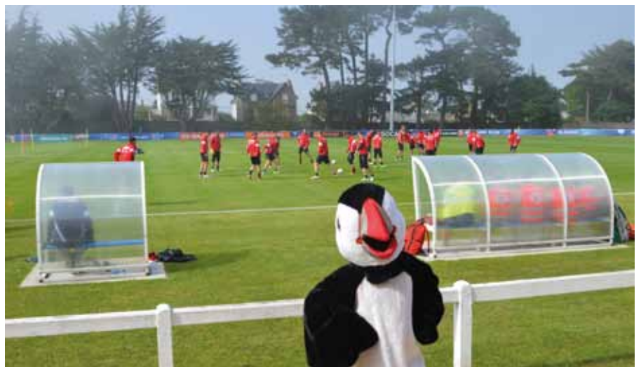
L'équipe de football d'Albanie, lors du Championnat d'Europe de football UEFA.

sportifs et accueillir d'autres grandes équipes sportives pour la notoriété de notre belle station balnéaire. Le soutien financier des associations ne se résout pas aux subventions mais un des points le plus important est l'aide technique, logistique comme la gratuité des salles, l'entretien des terrains. Prochainement à Kérambram, l'installation d'un nouveau skate parc, cet espace dédié à la jeunesse, est le premier gros investissement sportif de notre mandat, avec une offre différente des autres sites du Trégor. Le deuxième projet, dans nos bagages, est l'aménagement d'un grand espace multi-sports : salle de tennis de table, dojo, junomichi et aikido sans oublier un club house dédié aux associations pour améliorer l'échange entre les adhérents, créer du lien et de la convivialité.