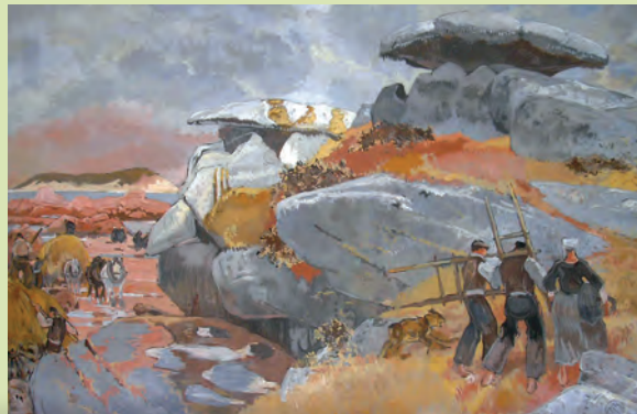
Mathurin MÉHEUT Ploumanach, les goémoniers, entre 1941 et 1946, caséine sur toile, 201 x 293 cm. Classé au titre des monuments historiques le 25 juin 1990. Collection Musée Université Rennes 1