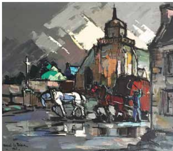
Perros-Guirec (22), L'église Saint-Jacques sous l'orage Huile sur toile, 58.50 x 71 cm, collection privée